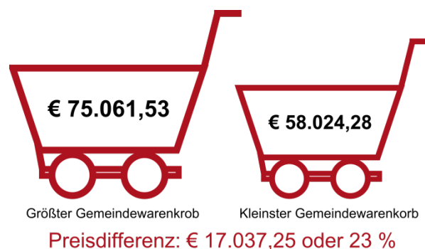
Abbildung 1 Interkommunaler Benchmark 3

Der teuerste Gemeindewarenkorb, sprich die Summe der teuersten Einkaufspreise für die vergleichbaren Produkte, weist einen Wert von € 75.061,53 auf. Die Summe der günstigsten Preise für die vergleichbaren Produkte ergibt einen Warenkorb in der Höhe von € 58.024,28. Vergleicht man nun diese beiden Warenkörbe, so ergibt sich eine Differenz von € 17.037,25 oder 23 %.