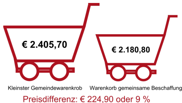
Abbildung 2 Benchmark günstigster Gemeindefahrenkorb - gemeinsame Beschaffung 5

Das Ergebnis des Vergleiches zeigt, dass auch bei den günstigsten Beschaffungspreisen der sieben Gemeinden des PV Ötztal, in Summe noch ein Einsparpotential von 9 % vorhanden ist. Die nachfolgende Tabelle zeigt einige konkrete Produkte, um das potentielle Einsparvolumen darzustellen.