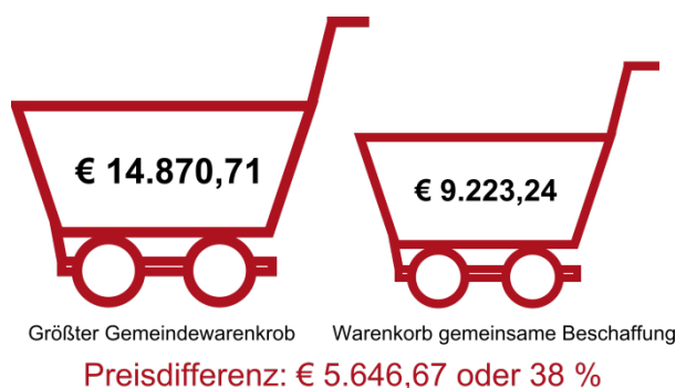
Abbildung 3 Benchmark teuerster Gemeindewarenkorb und gemeinsame Beschaffung 7

Um einen vollständigen Überblick, über die Beschaffungssituation im PV Ötztal zu erhalten, wird auch der teuerste Gemeindewarenkorb mit jenem der gemeinsamen Beschaffung verglichen. Dieser Benchmark zeigt noch deutlicher, welches Potential im Bereich der Beschaffung vorhanden ist.