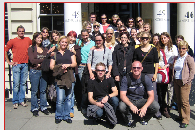
Die diesjährigen PraktikantInnen auf Exkursion in London

Donnerstag, 8. Oktober 2009 Audimax, 8:30 – 16:30 Uhr